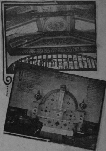
El cielo raso del patio estilo renacimiento español; observase la decoración, los artesanos tallados y la barandilla del balcón. El patio español de "El Sesteo" es una obra de arte de un gran artista: Eugenio Penón. Abajo: la fuente de aguas, el zircon de la frezura y de la canción del agua cristalina y buena

En Nueva York podrá haber restaurantes que imiten a "El Sesteo"; es difícil que los haya mejores