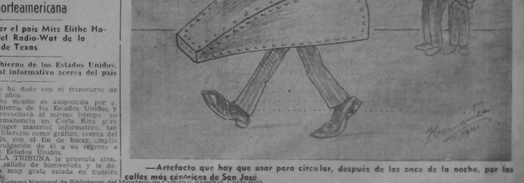
—Artefacto que hay que usar para circular, después de los once de la noche, por las calles más céntricas de San José. Este documento es propiedad de la Biblioteca Nacional "Miguel Obregón Lizano" del Sistema Nacional de Bibliotecas del Ministerio de Cultura, Juventud, Costa Rica.

En el avión regular de la Panga mercadería ingresó ayer al país la compañía Otate Informa que había desaparecido se precipitó a tierra en la tierra de Chakamano, por haber estallado el motor en el aire. Asegura que perecieron el piloto y el mecánico de la aeronave, y tres empleados de las minas de oro de Tiquita. La compañía espera una confirmación para enviar una comisión al lugar del siniestro.