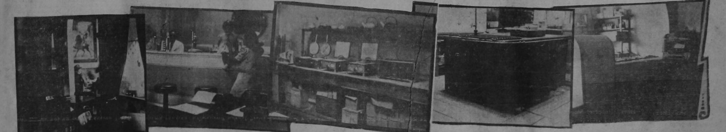
De izquierda a derecha: un juego de luces; adentro, pe nombra; afuera, detrás de la reja, el sol de la tarde. — El bar claro, limpio, invitador y sugestivo — Los aparatos de hacer tostadas, "Waffles" y sandwichs alineados en orden. — La cocina de "El Sesteo", obra en hierro fundido de Bonetti, ancha, grande, cómoda, clásica. — Y al extremo: la máquina de hacer helados a la vista del público. A lado, el aparato ortofónico.

No lo decimos nosotros, Lo dicen los más ilustres visitantes del país. Siempre hemos creído "El Sesteo" honra a Costa Rica. Es una satisfacción para nosotros llevar a un amigo extranjero, recién llegado al país, a tomar té o a comer a "El Sesteo". Nos sentimos íntimamente orgullosos.